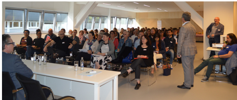
80 délégués de 50 communes ont participé au premier GRESIL