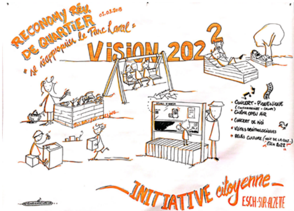
un co-design pour une vision

Contact : Éric Lavillunière (MESA) reconomy@cell.lu tél : +352 - 26 53 26 70