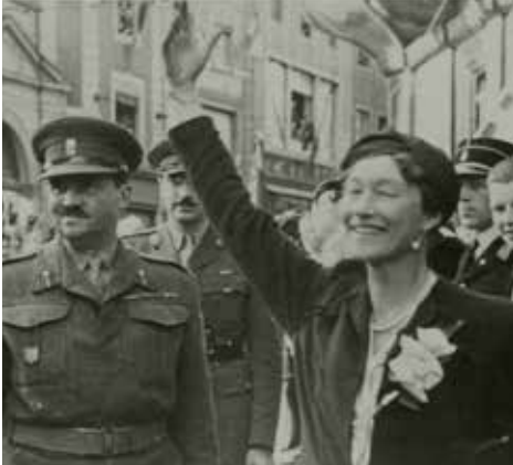
Grandüşes Charlotte 1944

Hemen savaş sonrası resesyonundan sonra ekonomik canlanma dönemi başlamıştır. Fakat