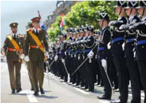
Milli Bayramda Grandük, ardında oğlu Veliht Grandük

Şeklen grandükün anayasaya göre hükümetini kendi takdirine bağlı meydana getirme hakkı vardır, yani bakanlıklar kurmak, daire şubelerini paylaştırmak, bunların üyelerini atamak gibi. Uygulamada grandük her beş yılda bir yapılan parlamento seçimlerinin sonucuna göre bir informateur (inceleme görüşmelerini yürüten bir kişi) ve/veya bir formateur (hükümet kurucusu)