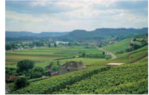
Mosel bölgesi: Nehir ve üzüm bağları